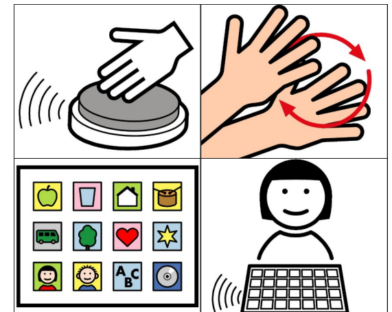
METACOM Symbole © Annette Kitzinger